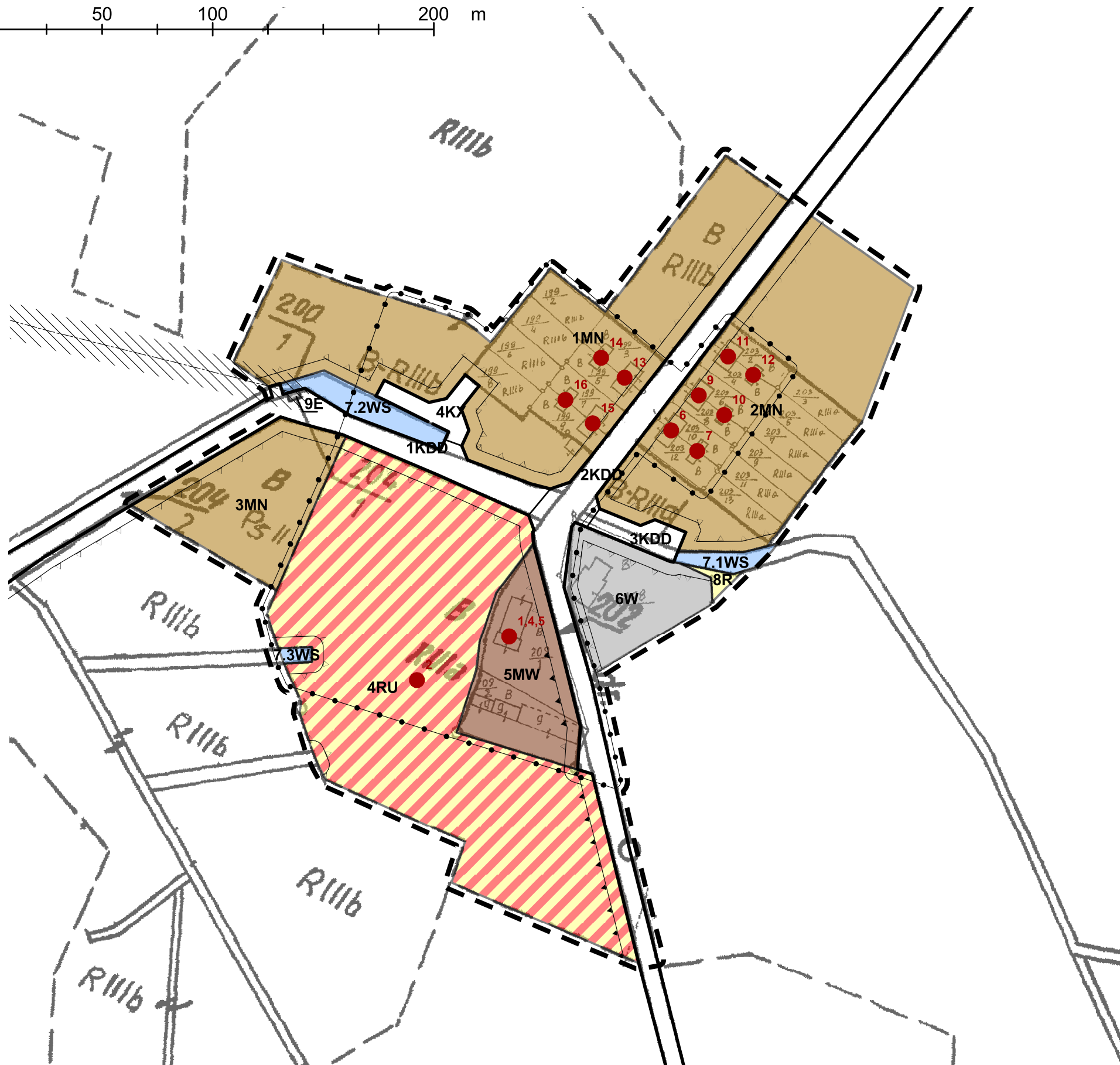
Mapa katastralna z zasobów Powiatowego Ośrodka Dokumentacji Geodezyjnej i Kartograficznej w Sztumie w bazie informatycznej EWMAPA5, w układzie "1965". Baza aktualna na dzień 30.06.2003 r.

WYRYS ZE STUDIUM UWARUNKOWAŃ I KIERUNKÓW ZAGOSPODAROWANIA PRZESTRZENNEGO GMINY STARY TARG, OBREB JURKOWICE