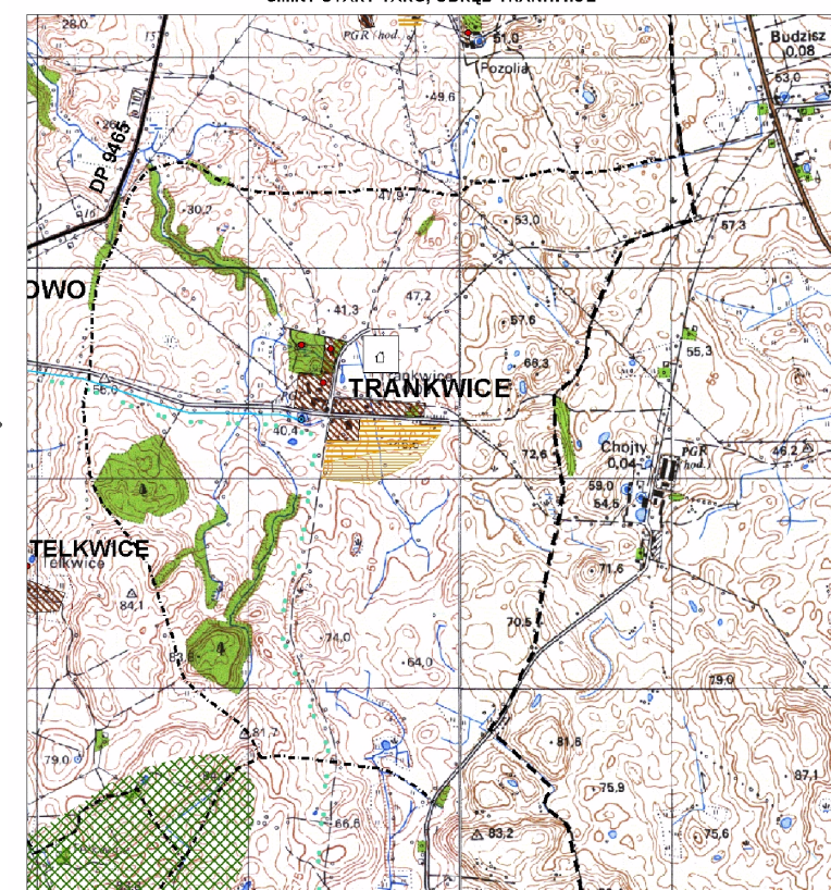
WYRYS ZE STUDIUM UWARUNKOWAŃ I KIERUNKÓW ZAGOSPODAROWANIA PRZESTRZENNEGO GMINY STARY TARG, OBRĘB TRANKWICE